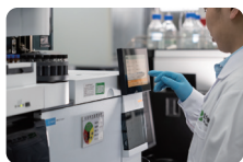
严格品质检验 pH、渗透压、外观等